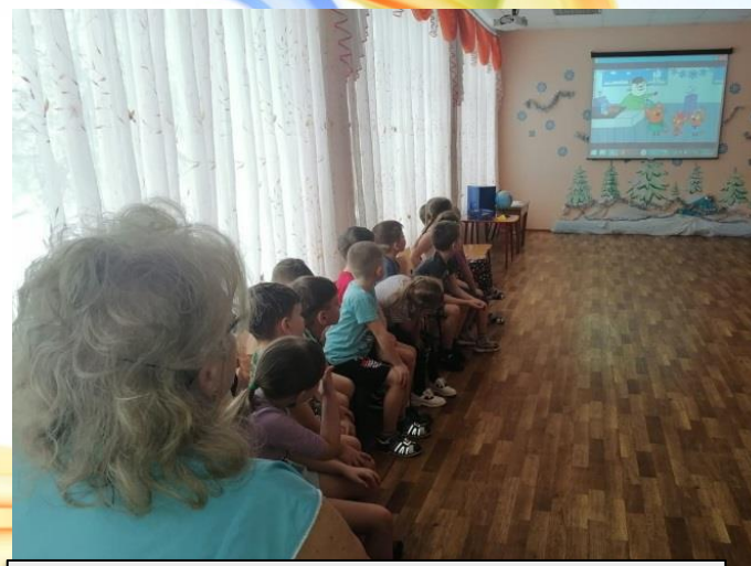
Просмотр мультфильма «Три кота».