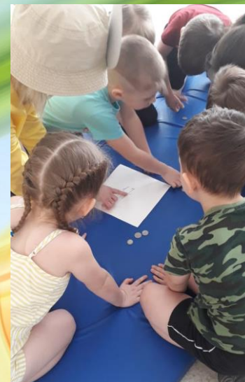
Учимся считать деньги