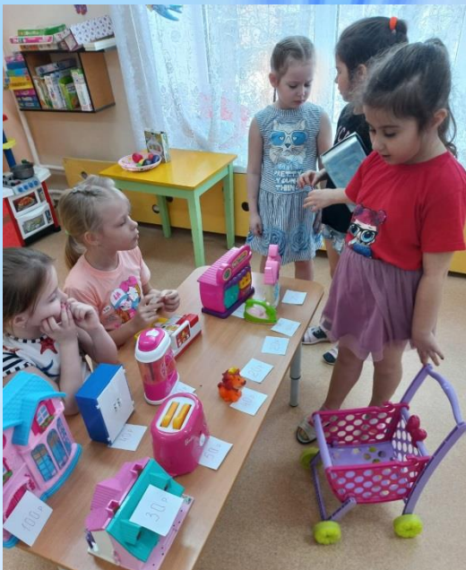
Сюжетно-ролевая игра «Магазин»