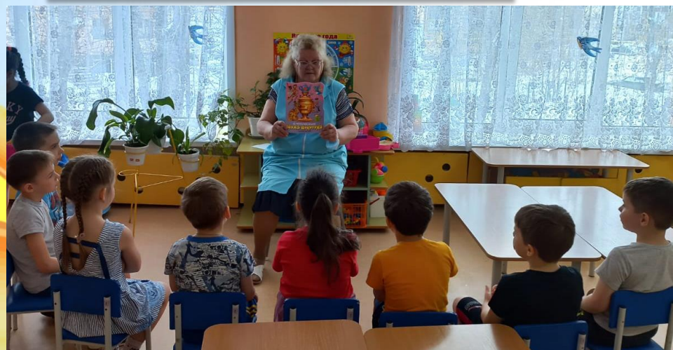
Чтение сказки «Муха Цокотуха» К.Чуковского